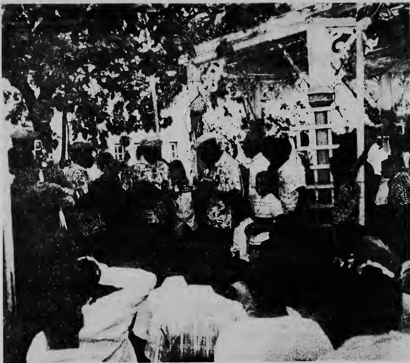
Exitoso tabata e prestacion di Tinba Sta. Rosa en a gana prome premio den e festival musical. Aquí nan ta ofreciendo un nieza di ujava pa e admirador nan despues cu nan triunfo ya tabata confirma.

luna vapornan e stranhera tur sotto di facilidadnan.